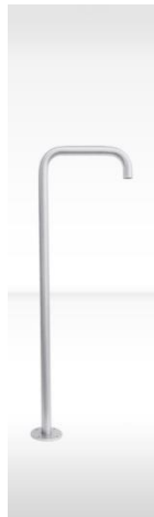
dade LAUF 2