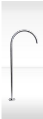
dade LAUF 3