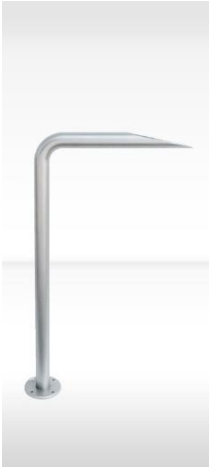
dade LAUF 1